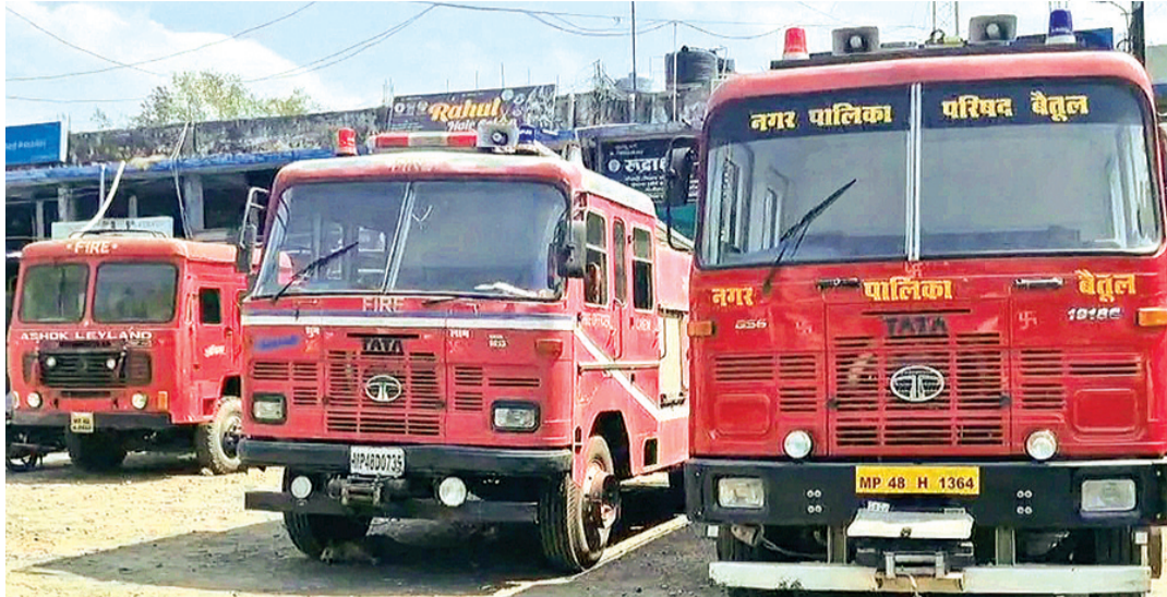
हरिभूमि न्यूज़ ▶▶ बैतूल

नया फायर स्टेशन बनाने के लिए नगरपालिका अभी तक जमीन ही तय नहीं कर पाई है। नगरपालिका ने फायर स्टेशन और आईएसबीटी के लिए पहले बैतूल-इंदौर हाइवे पर करबला के पास स्थित करीब 11 एकड़ जमीन उपयुक्त मानते हुए प्रक्रिया शुरू की थी। योजना के तहत 9 एकड़ में आईएसबीटी और 2 एकड़ में फायर स्टेशन बनाया जाना था। लेकिन जमीन नगरपालिका को हैंडओवर होने से पहले ही मामला विवादों में आ गया। इस जमीन को लेकर मंदिर से जुड़े लोगों ने कमिश्नर कोर्ट नर्मदापुरम में अपील दायर कर दी। इसके बाद नया ने जामठी क्षेत्र में जमीन देखी। नया ने आरसीएमएस पोर्टल पर जमीन की मांग को लेकर आवेदन भी कर दिया है। लेकिन अभी तक यह जमीन भी नगरपालिका को नहीं मिली है। जबकि अग्निशमन सेवाओं को आधुनिक (नए फायर स्टेशन) बनाने के लिए करीब 2 करोड़ रुपए स्वीकृत हुए और टेंडर होने के