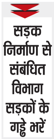
हरिभूमि न्यूज ▶▶▶ हरदा