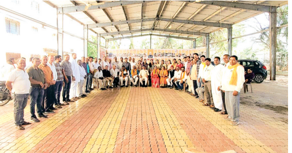
हरिभूमि न्यूज़ ▶▶ बैतूल