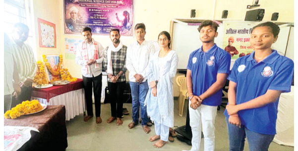
माखननगर

माखननगर में अखिल भारतीय विद्यार्थी परिषद द्वारा शहीद दिवस के अवसर पर शासकीय माखनलाल चतुर्वेदी स्मृति महाविद्यालय में श्रद्धांजलि सभा एवं चिंतन संगोष्ठी आयोजित की गई। कार्यक्रम में कई छात्र-छात्राएं, प्राध्यापक और कार्यकर्ता उपस्थित रहे।