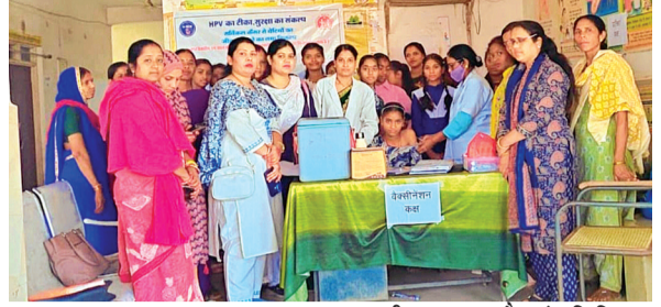
माखननगर